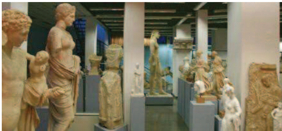
Μουσείο Εκμαγείων. Άποψη της αίθουσας Κ. Ρωμαίου

7.000 φωτογραφίες, εξυπηρετούν τομείς της έρευνας μεταπτυχιακών φοιτητών, υποψήφιων διδασκόντων και ερευνητών, αλλά και δράσεις των φοιτητών του Τμήματος στο πλαίσιο της πρακτικής τους άσκησης. Η λειτουργία και οι δραστηριότητες του Μουσείου στους εκθεσιακούς χώρους και το μικρό του αμφιθέατρο έχουν σκοπό κυρίως ερευνητικό και εκπαιδευτικό με τη μορφή οργάνωσης ξεναγήσεων για φοιτητές. Ταυτόχρονα, όμως, απευθύνονται και στο ευρύτερο κοινό με την πραγματοποίηση εκπαιδευτικών προγραμμάτων για μαθητές της πρωτοβάθμιας και Δευτεροβάθμιας Εκπαίδευσης, αλλά και ξεναγήσεων για το ενήλικο κοινό.