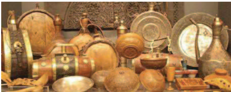
Παραδοσιακά σκεύη από τις συλλογές του Λαογραφικού Μουσείου

φικής και γλυπτικής, φιγούρες του θεάτρου σκιών), αλλά και αντικείμενα και έπιπλα που σχετίζονται με την ιστορία του συγκεκριμένου Μουσείου και με την ιστορία του ΑΠΘ, ενώ στο Σπουδαστήριο Λαογραφίας και Κοινωνικής Ανθρωπολογίας εκτίθεται και μια μικρή συλλογή μουσικών οργάνων. Το Μουσείο είναι ανοικτό στο κοινό, τους σπουδαστές και τους ερευνητές.