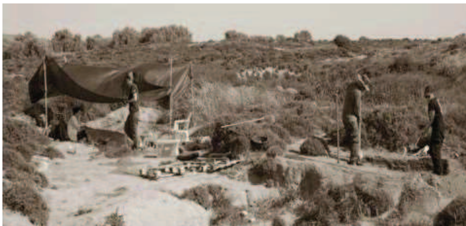
Η ανασκαφή της Παλαιολιθικής εγκατάστασης του 'Ούριακου' στη Λήμνο (11η χιλ. π.Χ.)